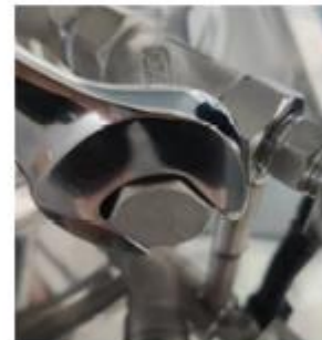
Режим открытого фильтра

3. Фильтр электромагнитного клапана: чтобы предотвратить засорение электромагнитного клапана остатками пищи, на лицевой стороне устройства установлен фильтр. Фильтр необходимо регулярно чистить после использования. Используя гаечный ключ, выкрутите болт с шестигранной головкой в фильтре, снимите внутренний металлический фильтр, чтобы очистить его, удалите мусор, а затем установите его обратно.