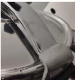
Балка и крюк

19. Электромагнитный клапан: когда на таймере отображается «0», электромагнитный клапан откроется, и из выпускного отверстия будут выходить пар и вода. Подготовьте термостойкий контейнер и заранее установите его на выпускное отверстие. После того, как давление полностью упадет и на манометре отобразится «0», откройте крышку повторно. Если внутри емкости осталось давление, при открытии крышки есть риск получить ожоги.