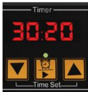
Панель настройки времени

достигнет заданного значения и индикатор нагревательного элемента погаснет, нажмите на кнопку таймера. При нажатии на кнопку «Пуск/Пауза» обратный отсчет начинается после того как вы услышите щелчок. По истечении заданного периода времени, электромагнитный клапан автоматически откроется для сброса пара. Конкретная настройка температуры и времени зависит от типа обжариваемых продуктов. Максимальное значение для установки таймера – 99 минут.