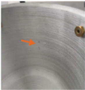
Индикатор отметки масла

10. Отметка масла/отметка уровня масла: налейте масло в емкость до отметки. Для предотвращения опасности и перелива масла через край не наливайте слишком много масла, иначе оно перельется через край.