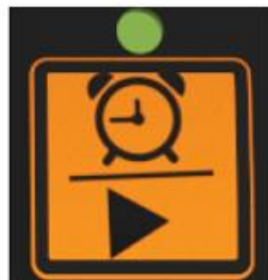
Кнопка включения таймера

13. Манометр: на манометре отображается давление водяного пара во фритюрнице для жарки под давлением. Нормальное рабочее давление составляет 6,8 - 7,2 фунтов на квадратный дюйм, около 49,5 кПа, 1 фунт на квадратный дюйм = 1 Ньютон/квадратный метр, нормальное положение стрелки прибора - в зеленой области манометра. При повышенном содержании влаги в обжариваемых продуктах значения давления увеличивается.